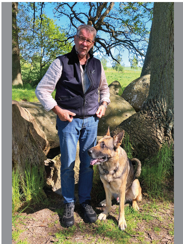
WOLFGANG & BRUNO (DEUTSCHER SCHÄFERHUND, 8 JAHRE)

Bruno braucht viele Streicheleinheiten, hat immer Hunger und liebt es, im Garten die Tauben zu jagen. Da wir viel zusammen sind, vertrauen wir uns sehr.